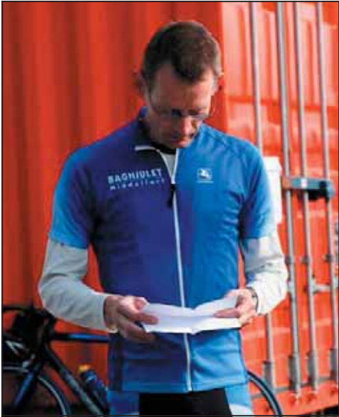
Så er formanden gået på talerstolen.