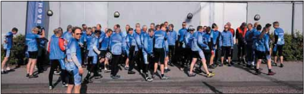
Opstilling til fotografering. Et større logistikarbejde. Og så endelig af sted på søndagstur.