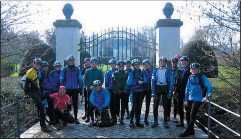
Derfor som sædvanlig ingen billeder med "ham-selv" på.

Mig og min rygsæk mødte op ved Broen 31. marts kl. 9:30 – Bilerne blev pakket og af sted gik det mod grænsen. Vores mål og mødested var en parkeringsplads ved grænsen. Her skulle vi mødes med tre gutter fra Chri-