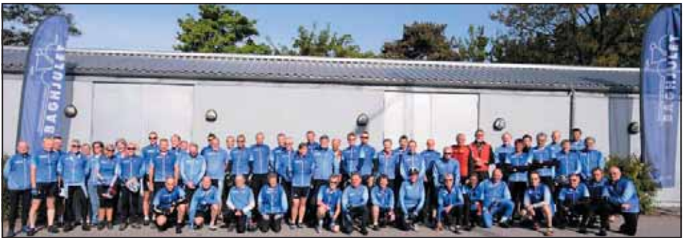
En del af Baghjulets medlemmer, fotograferet ved jubilæumsarrangementet den 6. maj.